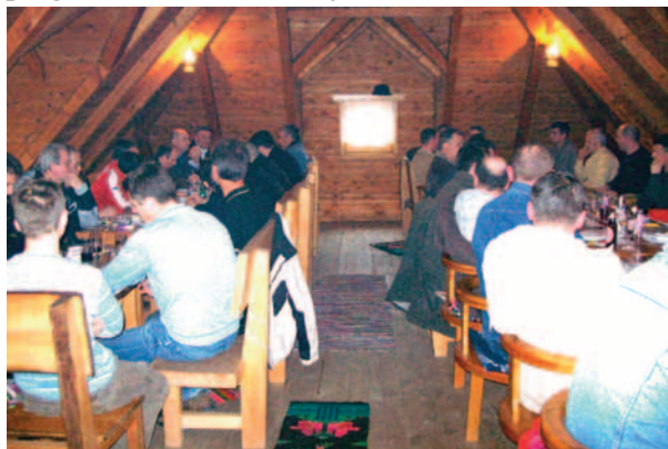
Susret čelništva HDZ-a 1990 Distrikt Brčko s ljudima iz dijaspore

Kako navodi gosp. Bjelonjić, posao na terenu je dobro odrađen, a sam on je uručio najmanje 50 obrazaca za glasovanje putem po-