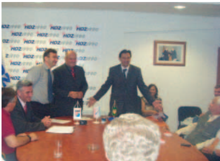
Koalicijski sporazum HDZ 1990, HSS-NHI, HSP potpisan 16.6.2008.

Uz Vašu potporu i snagom zajedništva idemo dalje!