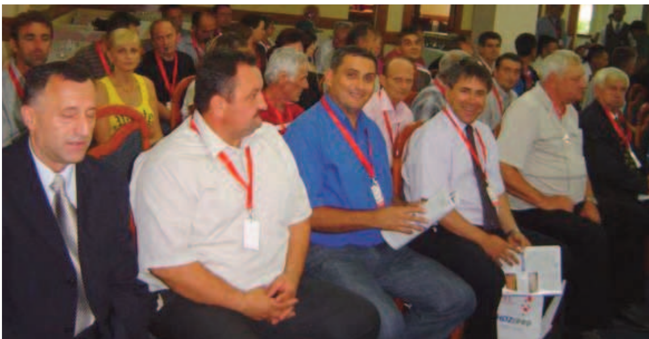
Gosti iz HDZ-a Republike Hrvatske

10. HDZ 1990 Distrikt Brčko poziva dijasporu, gospodarstvenike i prognanike da prepoznaju pravi trenutak za postupni povratak, te na programu hrvatskog zajedništva sudjeluju u političkom, gospodarskom, socijalnom i kulturnom oporavku područja s hrvatskom većinom u Brčko distriktu.