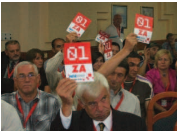
Svi za HDZ 1990. i za koaliciju HDZ 1990, HSS-NHI, HSP

On ističe iznimno značajnu ulogu mladeži HDZ-a 1990 u cjelokupnom političkom i društvenom djelovanju ove stranke. Navodi da mladež nije samo realizirala zacrtane stranačke ciljeve i projekte, nego i bila njihov idejni tvorac. Naglašava da