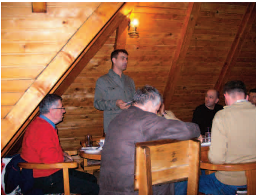
Prepuna „Petrova koliba“

dnju dijaspore s maticom (domovinom), što je na odobravanje svih i uvjetovalo nastanku kon-